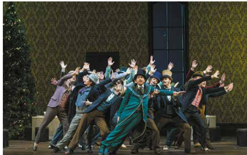
Le Domino noir de Daniel-François-Esprit Auber à l'Opéra Comique, Paris, mars 2018.

Enfin, après « French touch » la saison dernière, accentus et son chef associé Christophe Grapperon continuent d'explorer le répertoire français du XIX e siècle dans « Musique française à la lumière », à la Chapelle Corneille puis au Théâtre des Bouffes du Nord, à l'invitation du Palazzetto Bru Zane.