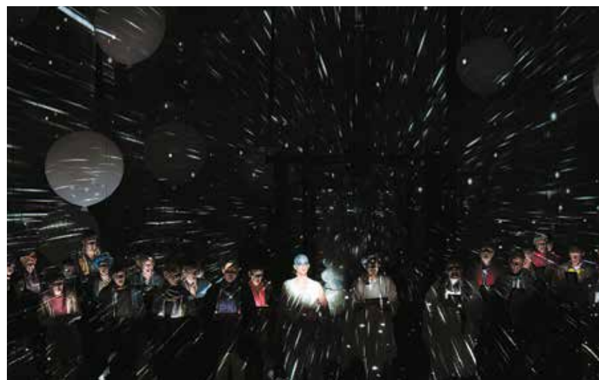
La Création de Joseph Haydn à La Seine Musicale, Île Seguin, mai 2017.